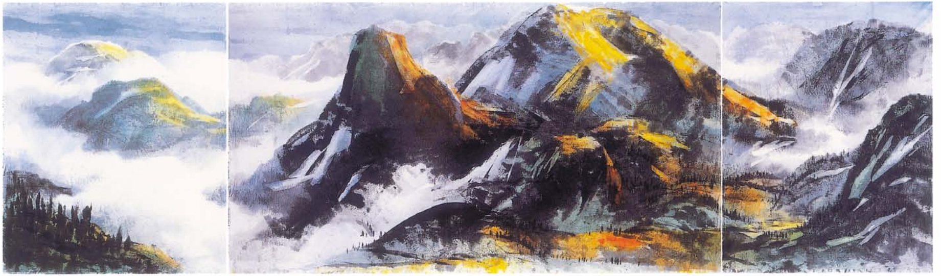
峻嶺騁懷 畫布·墨·壓克力 150×580cm (三連作) 2001