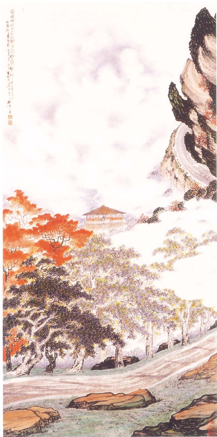
思入風雲變態中 紙本 69×170cm