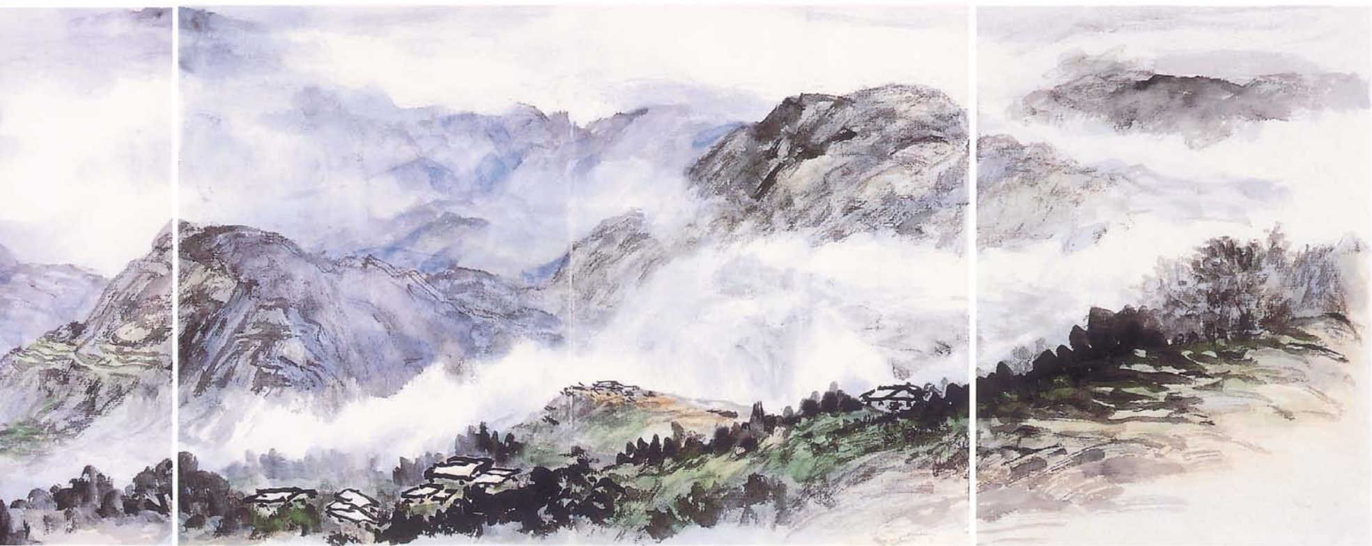
清靖山脈 頁冊（宣紙·墨·中國及水彩顏料） 31.5×155cm 1995