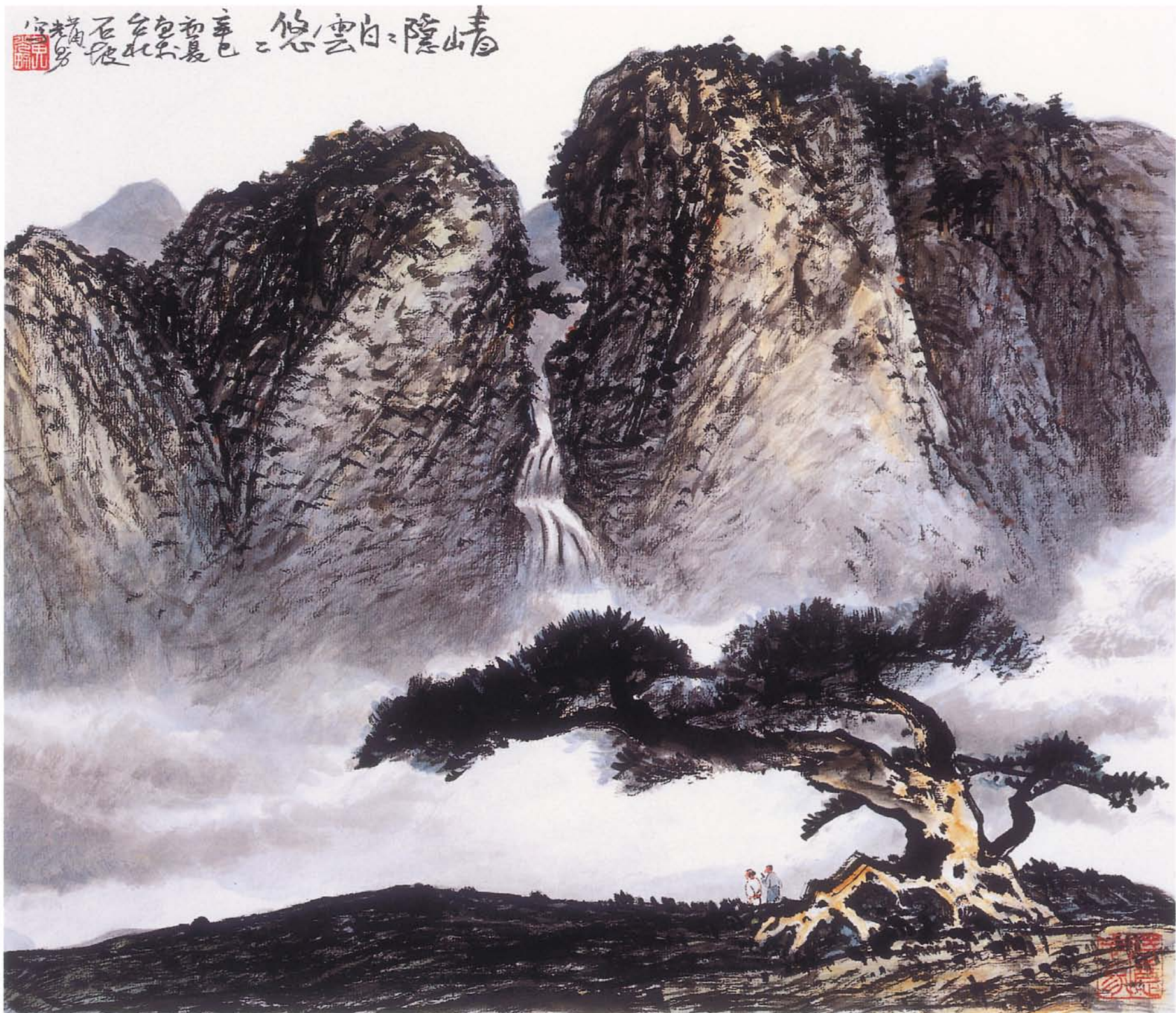
青山隱隱白雲悠悠 水墨