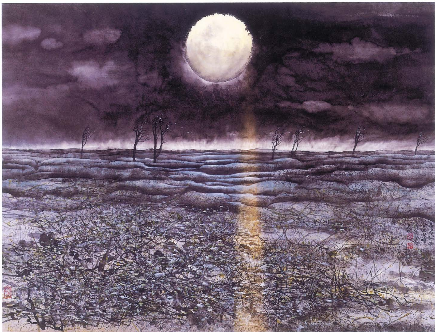
月照大荒 水墨 75×100cm 2000