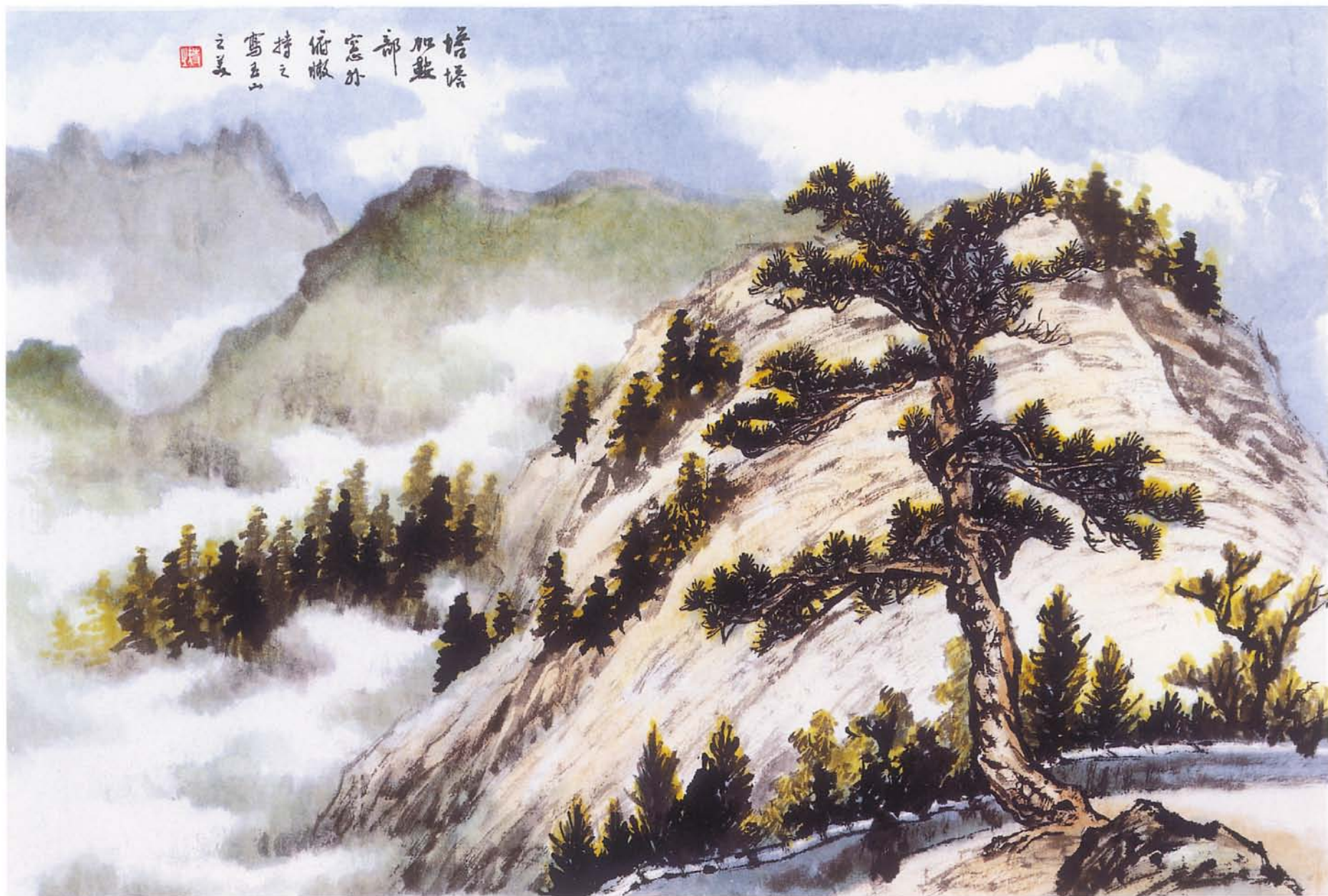
塔塔加寫景 水墨 60×90cm 2001