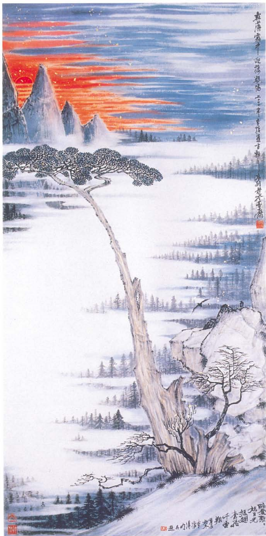
在薄霧中迎接朝陽 紙本 69×170cm